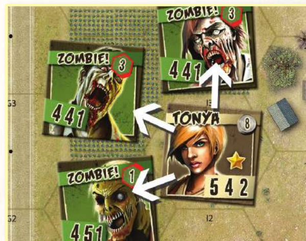
Tre dadi fuoco possono attaccare tre bersagli adiacenti.

Ogni Dado può potenzialmente infliggere danno a un bersaglio, e in molti casi ogni dado in eccesso può essere applicato a bersagli aggiuntivi. Il numero dei Dadi definisce anche la diffusione in esagoni dell'arma, o il numero di esagoni che può attaccare simultaneamente (fa eccezione il fucile [shotgun]; ogni suo dado deve attaccare lo stesso esagono).